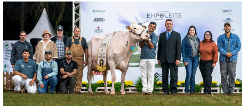
Grande Campeã variedade HVB - CONSTENTATION LOLITA SWINGMAN (João Cornelio Los) Grande Campeã variedade HPB - ARM LETTI MITCHELL 99 (Armando Rabbers)