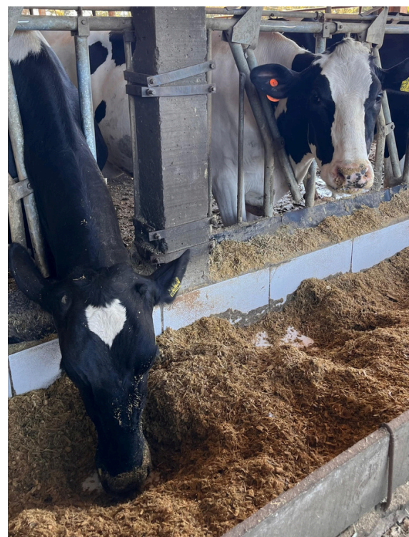
O sistema Compost Barn trouxe mais conforto ao rebanho, favorecendo a regularidade da produção e a melhoria dos índices reprodutivos.