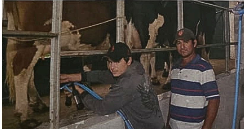
Pai e filho dão continuidade à atividade leiteira ao longo dos anos, unindo experiência e conhecimento técnico na gestão da propriedade.