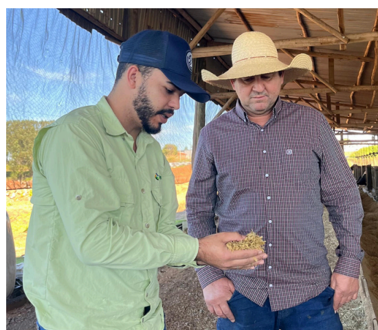
O acompanhamento técnico da Capal contribui para decisões mais precisas em nutrição, manejo e eficiência da produção leiteira.

Outro fator decisivo para o desenvolvimento da atividade foi o suporte técnico oferecido pela Capal.